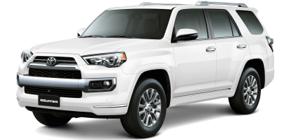
040 SÚPER BLANCO