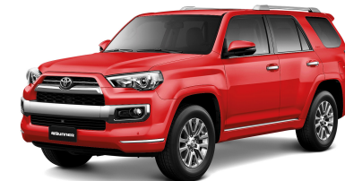
3R3 ROJO MICA METÁLICO