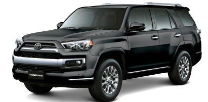
1G3 GRIS METÁLICO