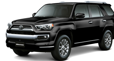
218 NEGRO MICA