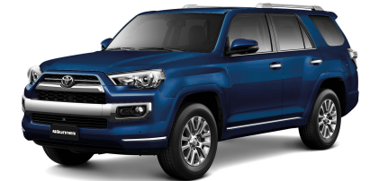
8S6 AZUL OSCURO MICA