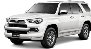
070 BLANCO PERLA