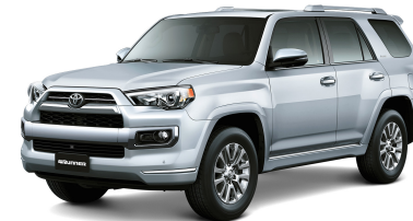
1F7 PLATEADO METÁLICO